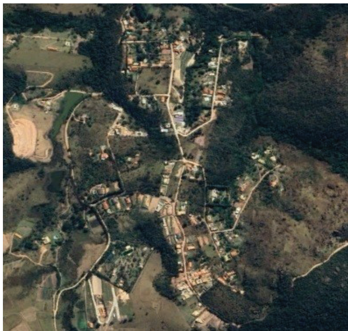
Coordenadas UTM 341849.04 m E 7435772.72 m S